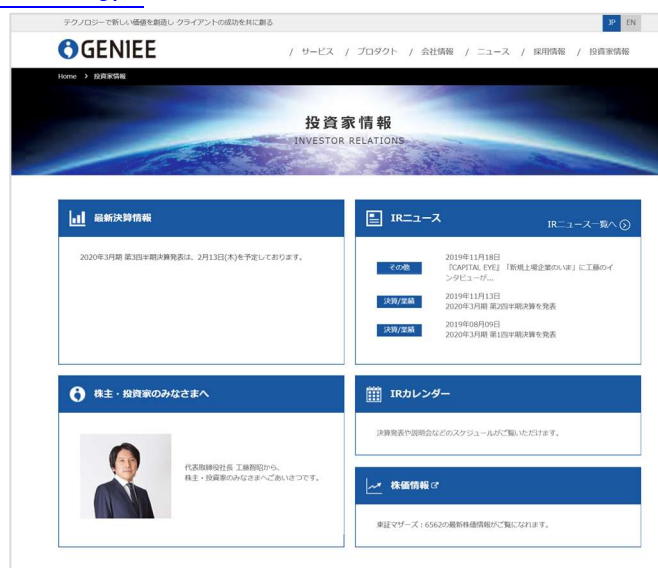
投資家情報ページ